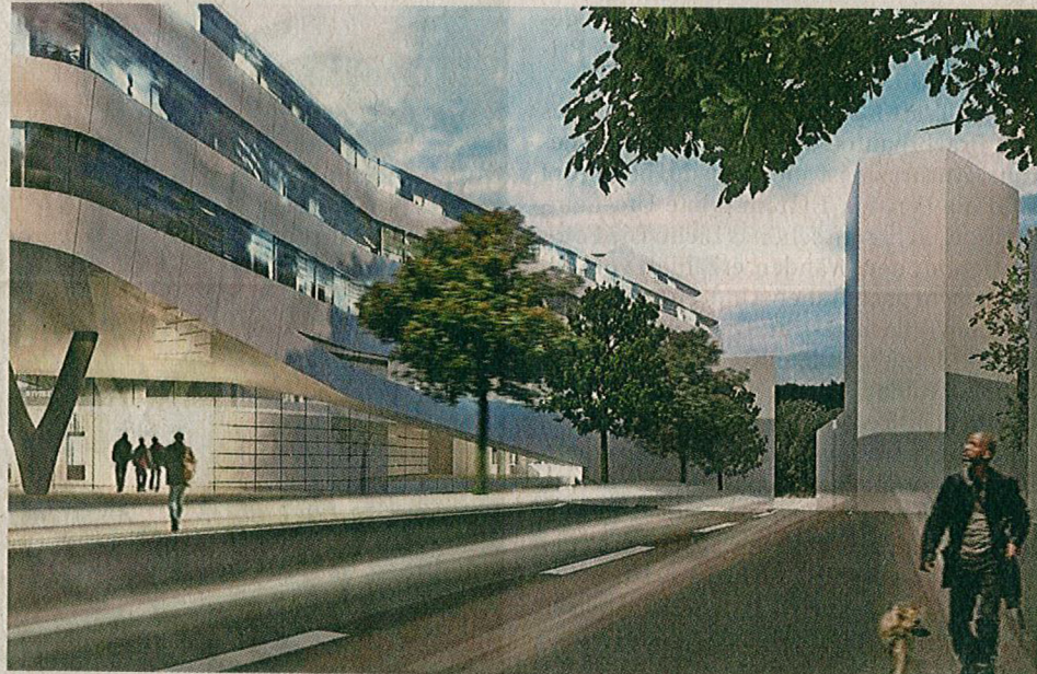
Der Mann mit Hund rechts unten ist Will Smith im Film „I am Legend“. Links das Bild im Original.

Der prominente Passant soll aber bald Geschichte sein. „Das werden wir bei der Überarbeitung der Bilder ändern“, sagt Steinmaier. Aber vielleicht lädt Südwestmetall Smith ja zur Eröffnung der neuen Zentrale ein, die fürs Jahr 2018 geplant ist. Ein bisschen Glamour kann bei solchen Anlässen ja nicht schaden. Der Hund muss dann aber einstweilen draußen warten.